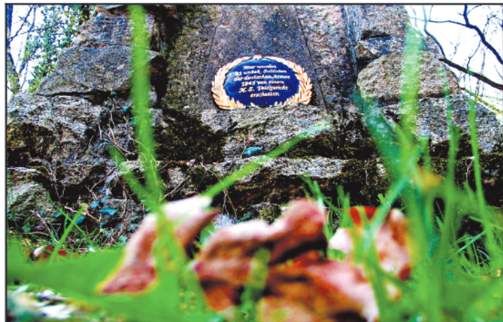
„Und dann haben sie ihn in die Grube rein gehaut und zugeschüttet.“ Im Wald von Oberretzbach.